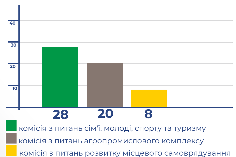
КОМІСІЇ З НАЙМЕНШОЮ КІЛЬКІСТЮ РОЗГЛЯНУТИХ ПИТАНЬ: