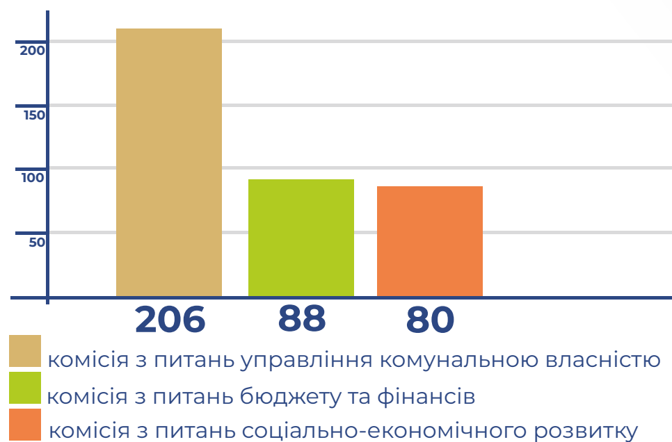
КОМІСІЇ З НАЙБІЛЬШОЮ КІЛЬКІСТЮ ПИТАНЬ, РЕКОМЕНДОВАНИХ ДО РОЗГЛЯДУ НА СЕСІЯХ: